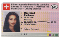
Permis de conduire Copie recto