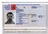
Passeport Copie de la page avec votre photo et votre signature