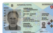
Autorisation de séjour Copie recto verso

Veillez envoyer la copie d'une pièce d'identité avec la demande à: Cornèr Banque SA Succursale BonusCard (Zurich) Case postale 8021 Zurich