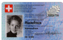
Carte d'identité Copie recto verso